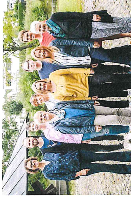
Die Lehrkräfte des Fachbereichs Kinderpflege.